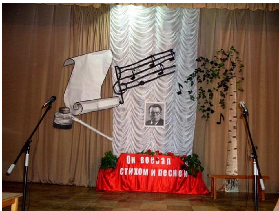
Оформление сцены к программе, посвященной 120-летию со дня рождения М.В. Исаковского