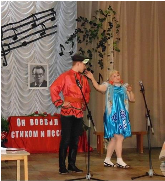
Инсценировка песни "И кто его знает"