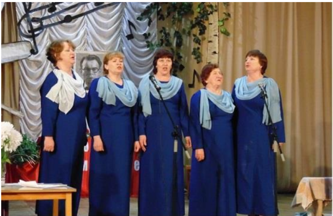
Вокальная группа исполняет песни М. Исаковского