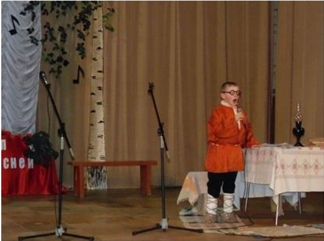
"Миша Исаковский" читает свое первое стихотворение "Просьба солдата"