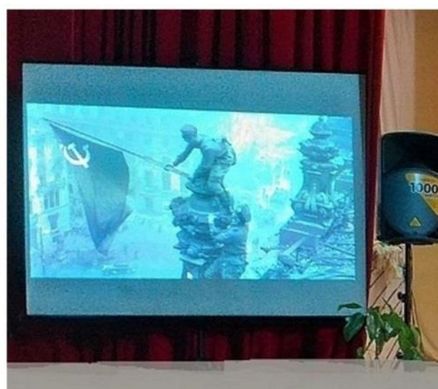
Показ слайдов к программе "Живое слово сердца моего"