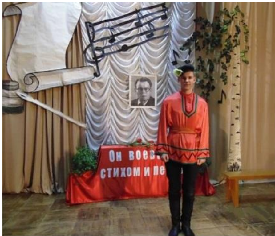
Чтение стихотворения "Слово о России"