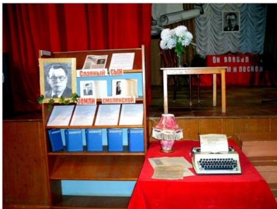
Стенд "Славный сын Земли смоленской", к 120-летию со дня рождения М.В. Исаковского