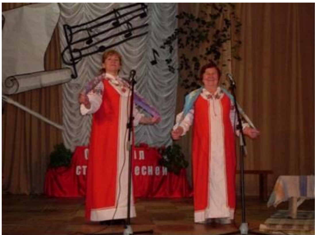
Исполнение песни "Вдоль деревни"