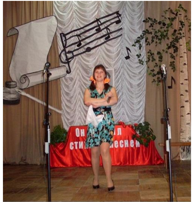
Исполнение песни "Катюша"